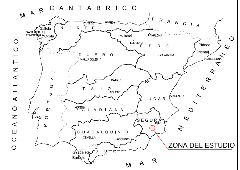
MAPA DE SITUACION