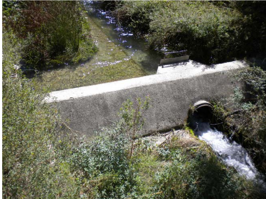
Fotografía 23: Azud en el tramo urbano de Nerpio. PK ACE 12+720 en el río Acedas.