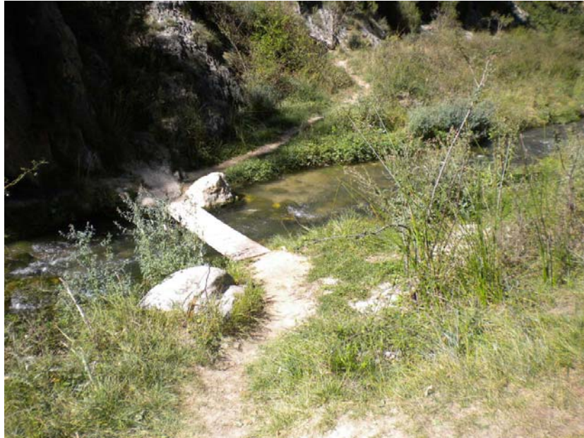
Fotografía 25: Pasarela de tabloneros en PK_{TAI} 20+700 .