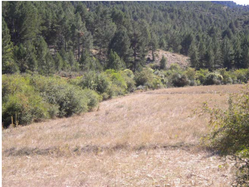
Fotografía 7: Río Taibilla, MI de tramo entre PK_{TAI} 0+800 y PK_{TAI} 1+400.