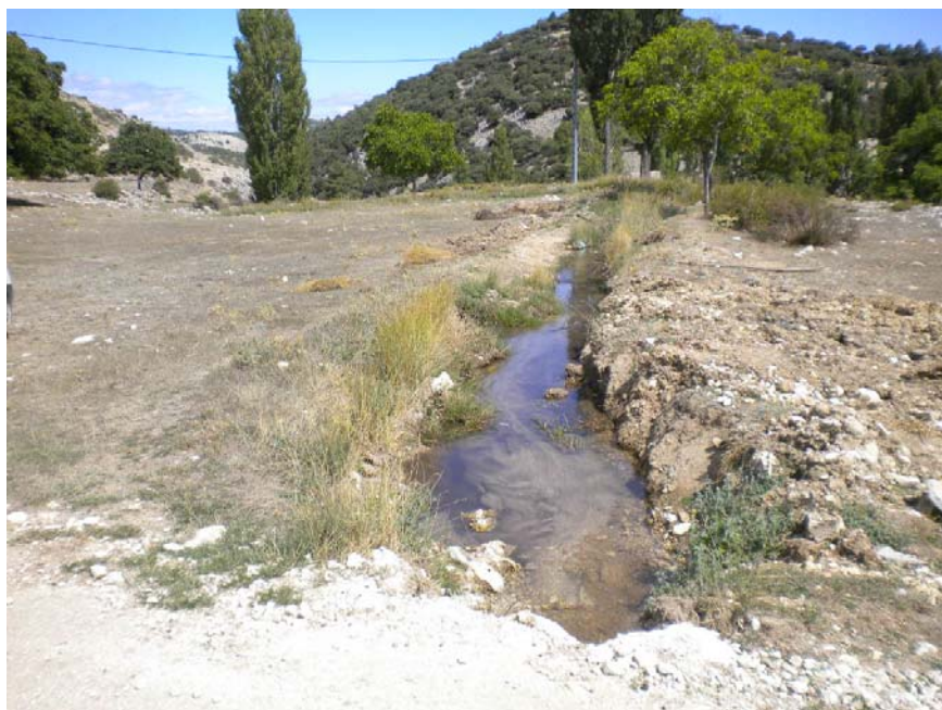
Fotografía 4: Zona de posible área recreativa en Pincorto de Abajo. Canalización que proviene de la Fuente Hermosa.