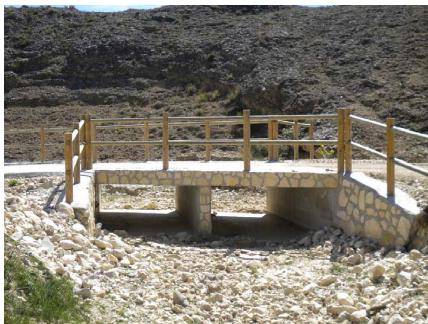
Fotografía 18: Obras de paso en Pedro Andrés. PK TAI 6+250.