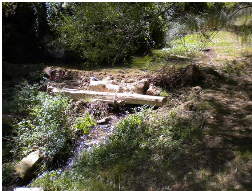
Fotografía 21: Derivación hacia una acequia de riego en la MD. PK_{TAI} 7+500.