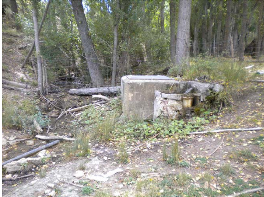
Fotografía 1: Arqueta en Arroyo Bogarra.