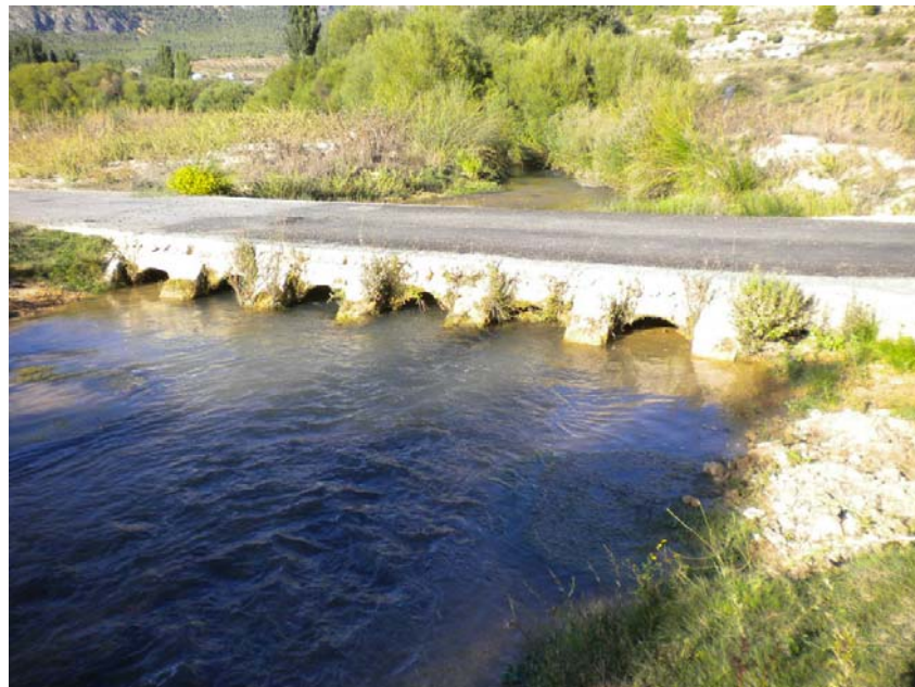
Fotografía 26: Obra de paso de la carretera en el PK_{TAI} 21+840 .