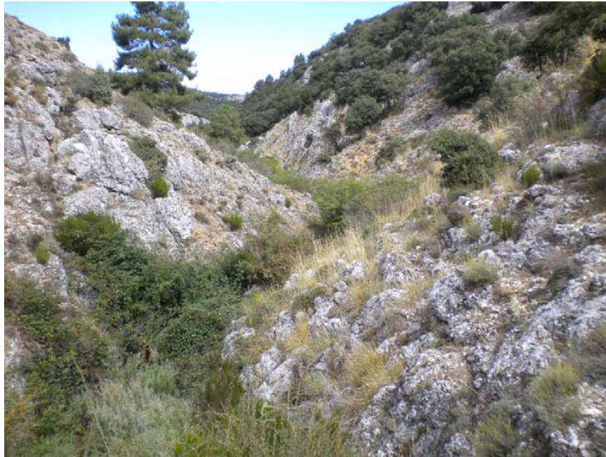
Fotografía 3: Arroyo Bogarra aguas abajo del Molino.