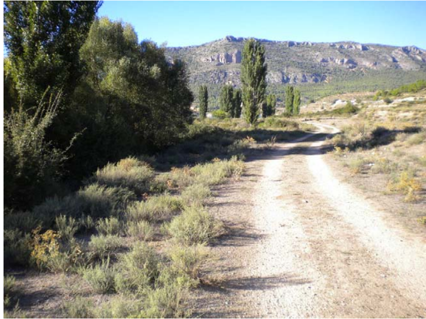
Fotografía 27: Margen derecha sin vegetación de ribera. PK TAI 21+900 en la cola del embalse.