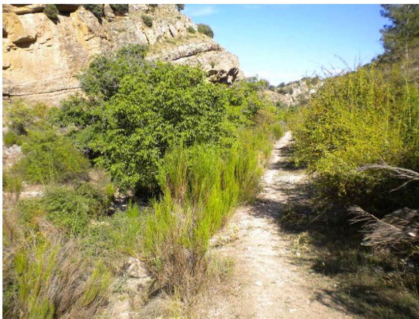
Fotografía 10: Senda en MD de un antiguo Camino Real entre Cortijo Nuevo y Pincorto. PK TAI 1+700 del río Taibilla.