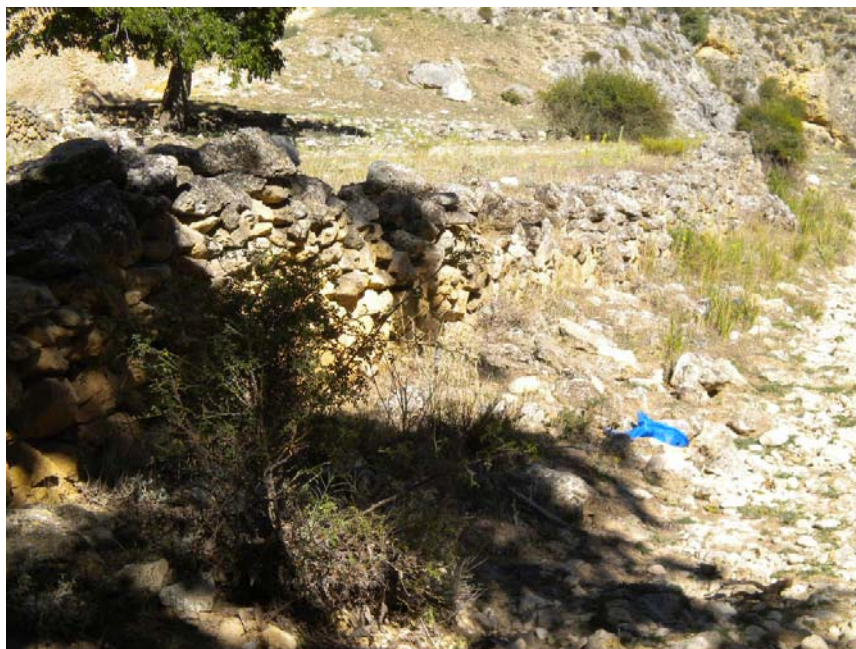
Fotografía 12: Muro de piedras en MI a la altura de las Casas de las Quintarías de Abajo. Pk TAI 1+800 del Río Taibilla.