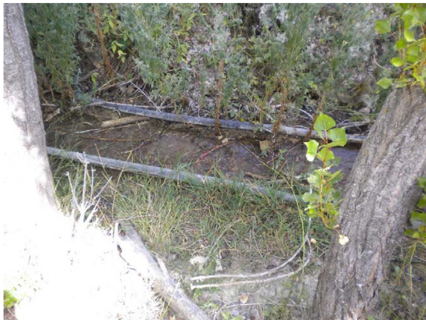
Fotografía 2: Tuberías de PEAD en el lecho de Arroyo Bogarra (PK BOG 0+100) y continúan en el Arroyo Molino.