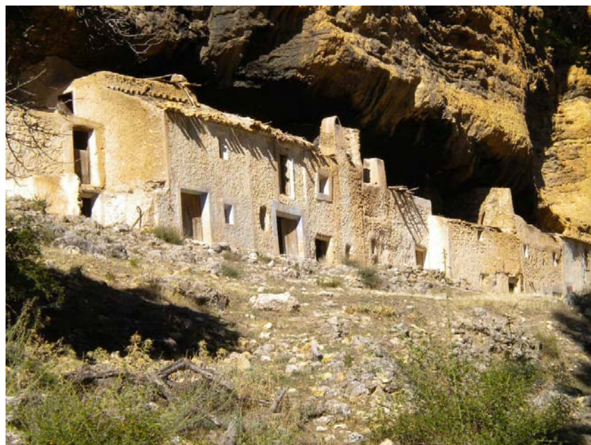
Fotografía 8: Casas de las Quintarías de Arriba.