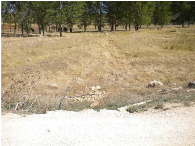
Fotografía 5: Arroyo Huebras, aguas abajo del cruce con la pista forestal. Prado mesofítico y chopera (Pk HUE 0+600).