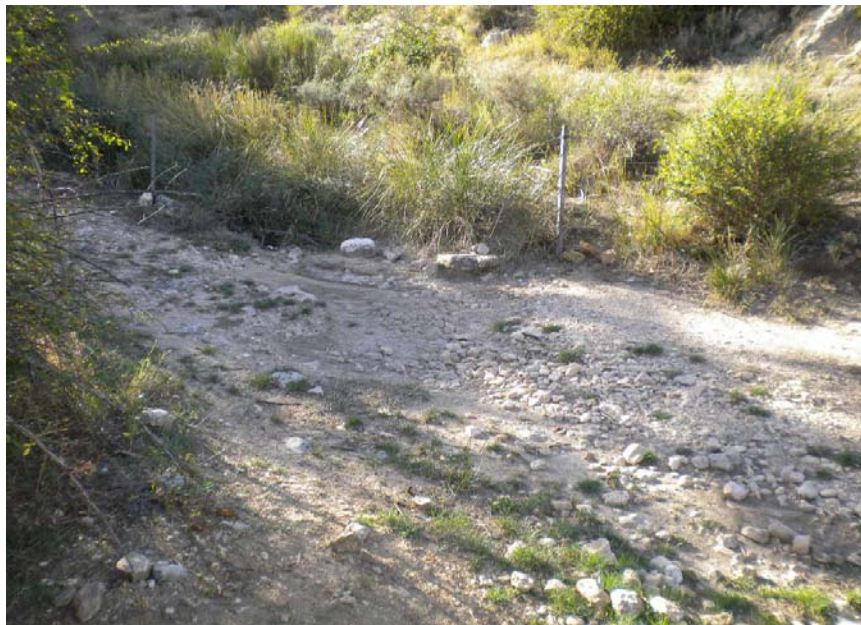
Fotografía 14: Camino de tierra y vallado metálico en lecho de cauce. PK TAI 2+260.