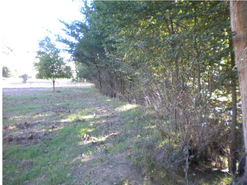
Fotografía 15: Ejemplo de presión agrícola. Ausencia de vegetación en márgenes. PK TAI 4+100.