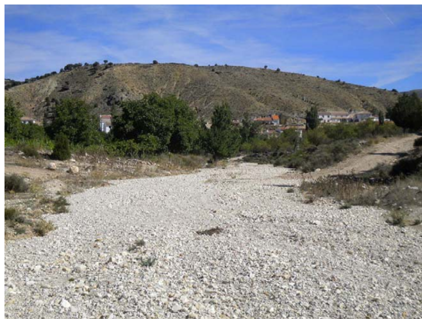
Fotografía 16: Cruce de camino en lecho. PK BBL 1+150 en Barranco Blanco.