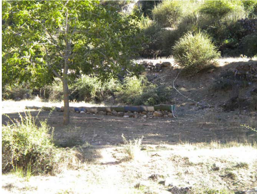
Fotografía 13: Abrevadero metálico en las Casas de las Quitarías de Abajo, abastecido por tubería sobre tierra.