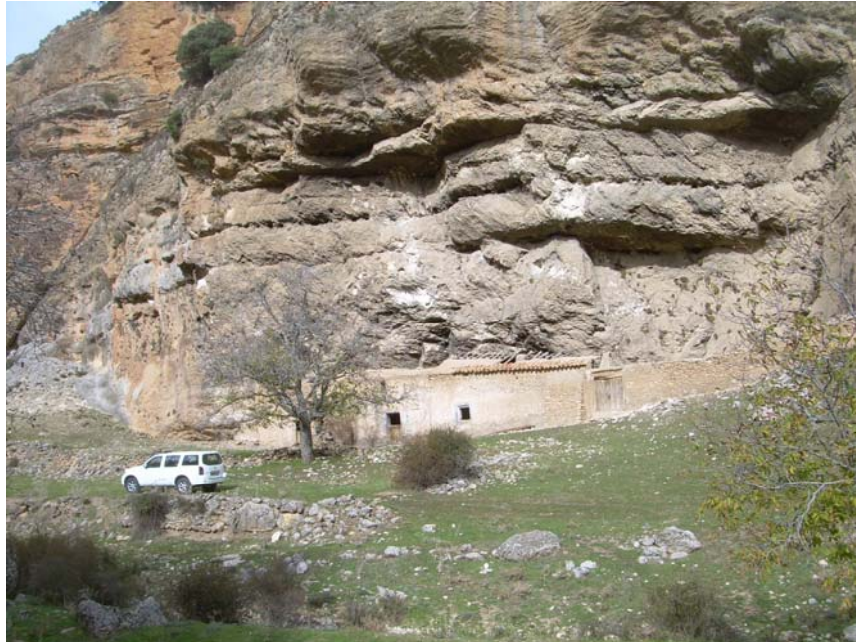
Fotografía 11: Casas de las Quintarías de Abajo.