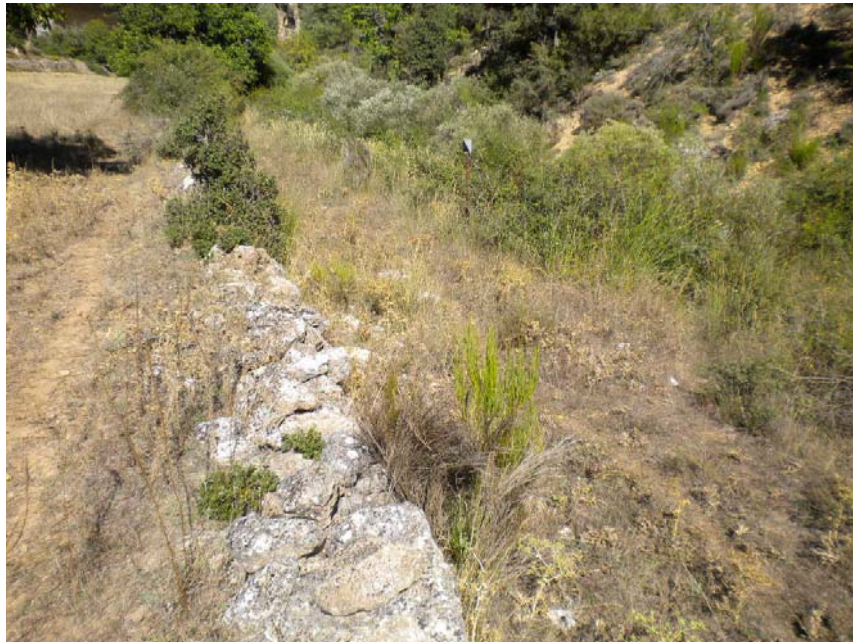
Fotografía 9: Muro de piedras en MI a la altura de las Casas de las Quintarías de Arriba.