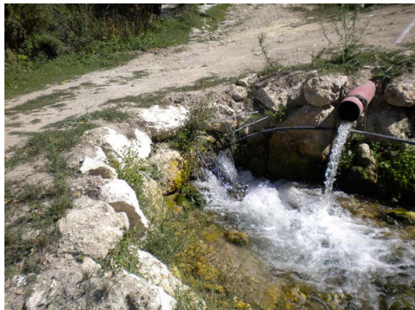
Fotografía 24: Obra de paso (Pk ACE 12+900) y vertido de la depuradora municipal Nerpio.