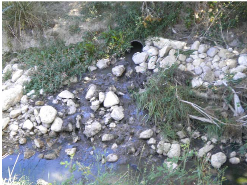
Fotografía 20: Vertido de la depuradora de Pedro Andrés. PK TAI 6+425.