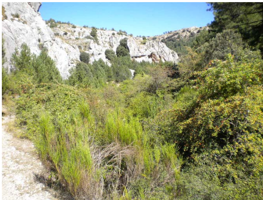
Fotografía 6: Arroyo Molino aguas abajo de la confluencia con Arroyo Huebras (Pk MOL 2+600).