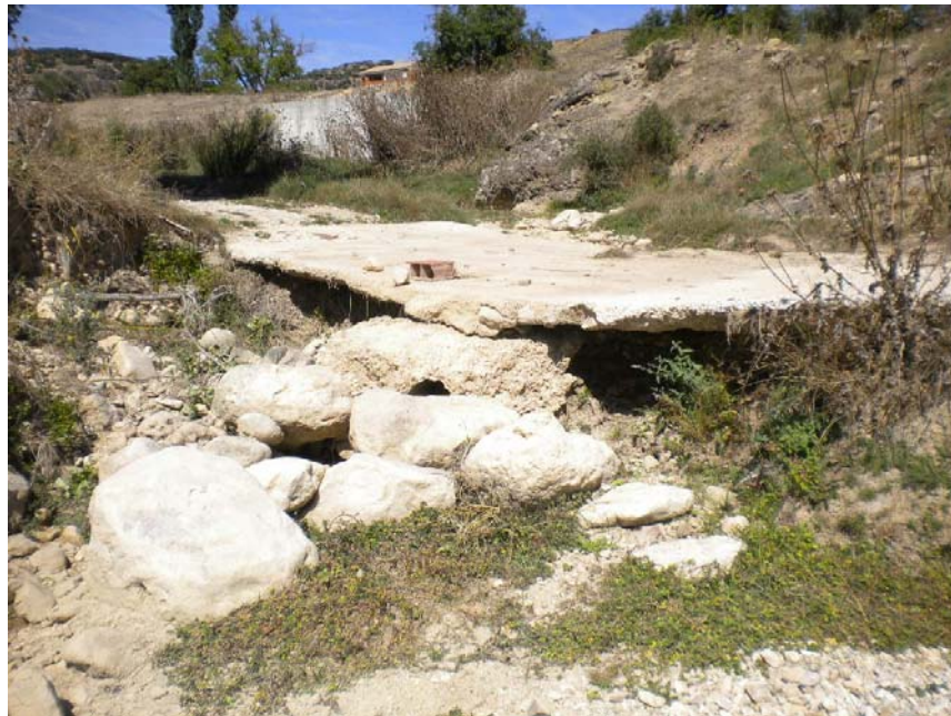
Fotografía 19: Cruce de camino hormigonado en lecho de cauce. PK TAI 6+350.