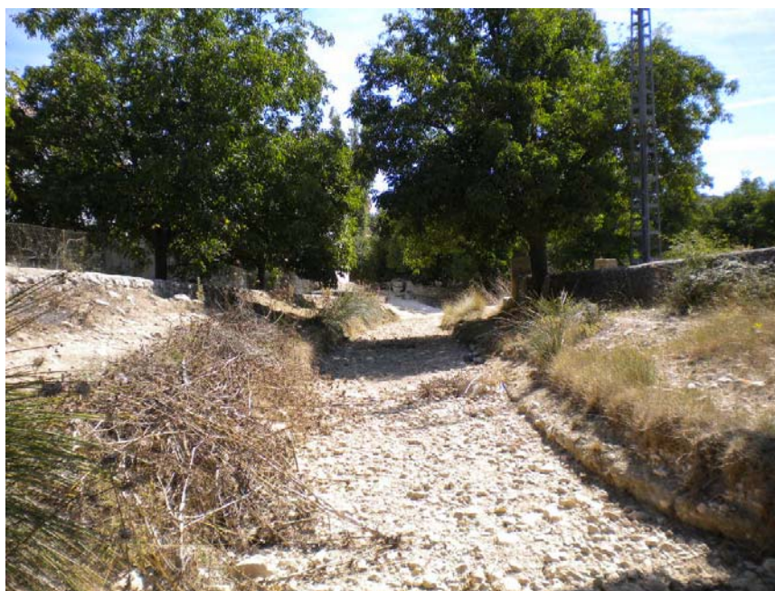
Fotografía 17: Cauce canalizado con muros en ambos márgenes. PK TAI 5+840-5+884 en río Taibilla (Pedro Andrés).