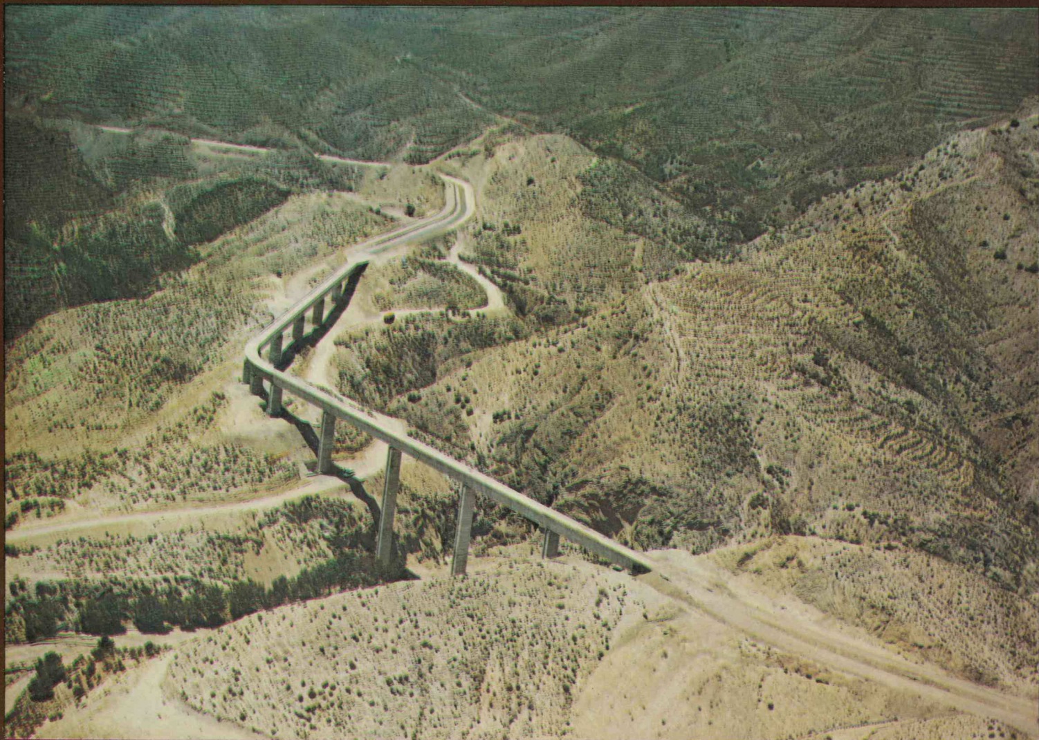
AQUEDUCTS DE CHICHARRA ET YESOS