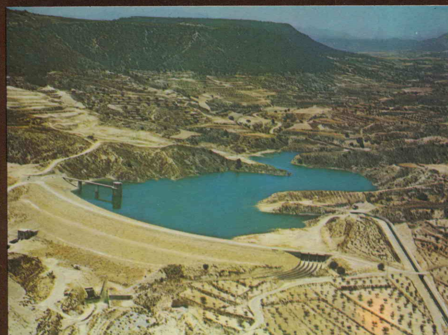
RESERVOIR DE MAYÉS