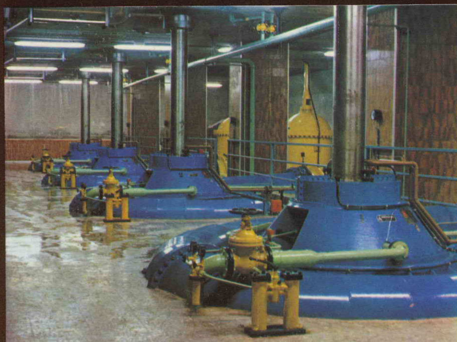
STATION DE POMPAGE DE OJÓS