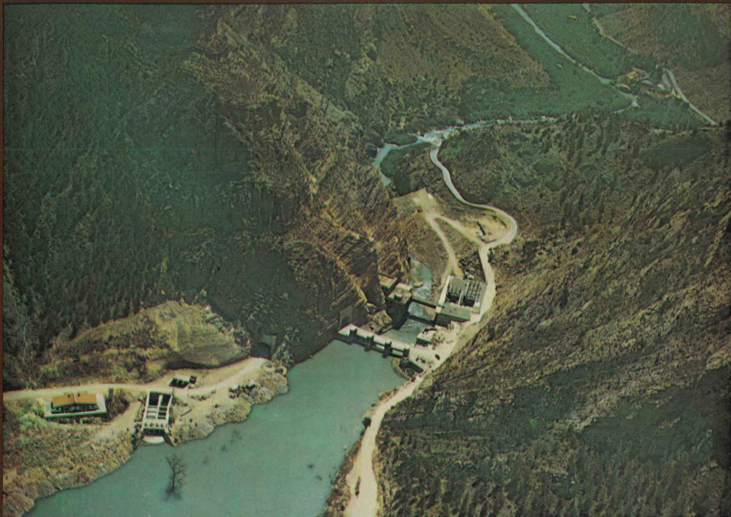
BARRAGE DE DÉRIVATION DE OJÓS